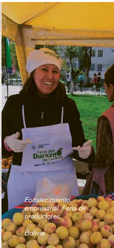
Fortalecimiento empresarial. Feria de productores.