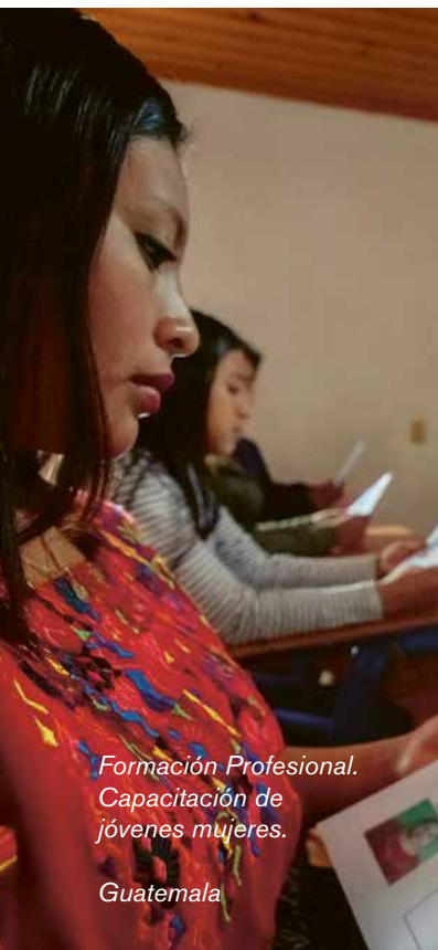
Formación Profesional. Capacitación de jóvenes mujeres.