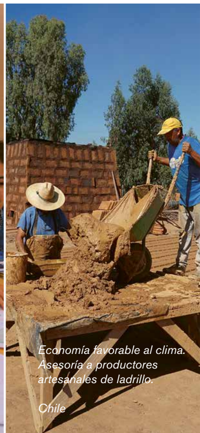
Economía favorable al clima. Asesoría a productores artesanales de ladrillo.