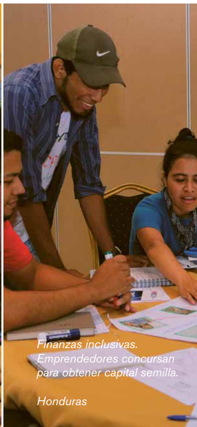
Finanzas inclusivas. Emprendedores concursan para obtener capital semilla.