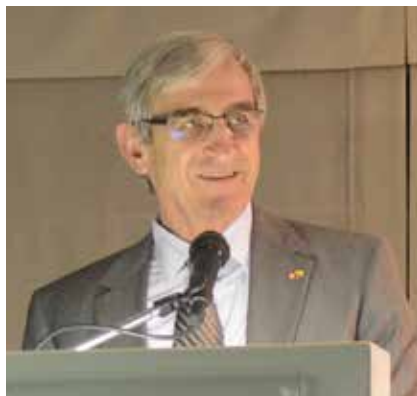
Peter Bischof Embajador de Suiza en Bolivia

Los grandes desafíos de nuestro tiempo son de carácter global. Suiza quiere asumir su responsabilidad. Quiere defender sus intereses y aportar para que el mundo tenga mejores posibilidades de paz y mejores oportunidades para las próximas generaciones ¡Un mundo de la gente y para la gente! Buena lectura, estimados lectores y lectoras, espero que esta nueva edición sea de su agrado.