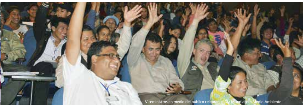
Viceministros en medio del público celebran el Día Mundial del Medio Ambiente