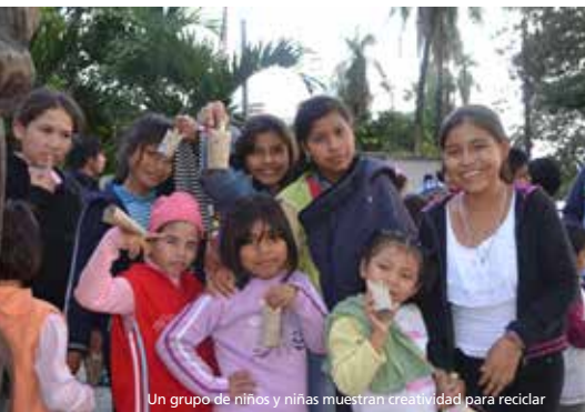
Un grupo de niños y niñas muestran creatividad para reciclar

Más información en: www.boliviafestijazz.com – http://www.christydoran.ch/nb/ http://www.youtube.com/watch?v=DoC777mlg4A