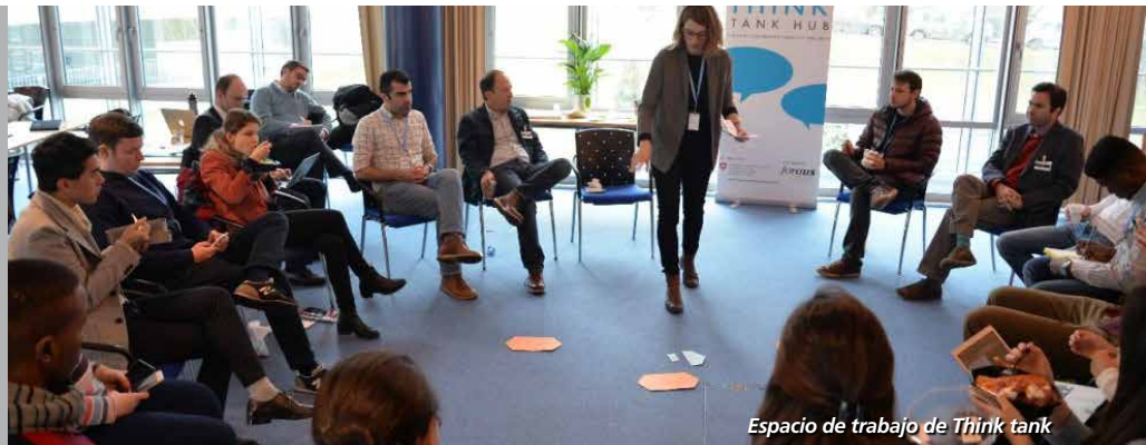
Espacio de trabajo de Think tank

El Think Tank Hub, es una iniciativa del Departamento Federal Suizo de Asuntos Exteriores, ofrece de forma gratuita 6 espacios de trabajo totalmente equipados , así como salas de conferencia para Think Tanks, de todo el mundo que buscan una oficina temporal en Ginebra/Suiza ya sea para reuniones, conferencias o investigaciones.