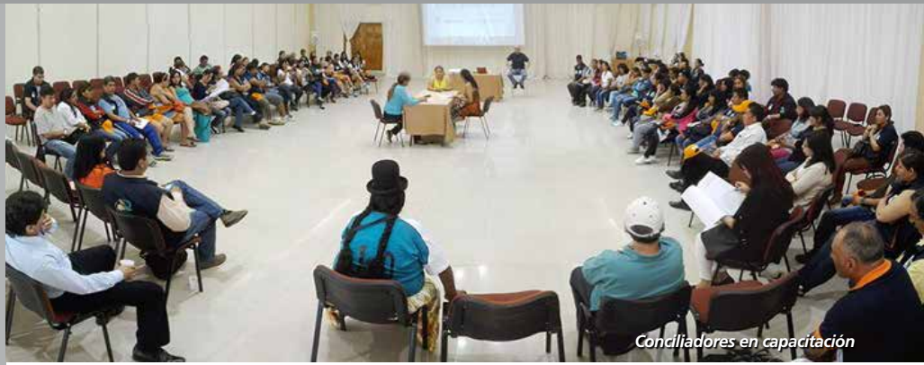
Conciliadores en capacitación