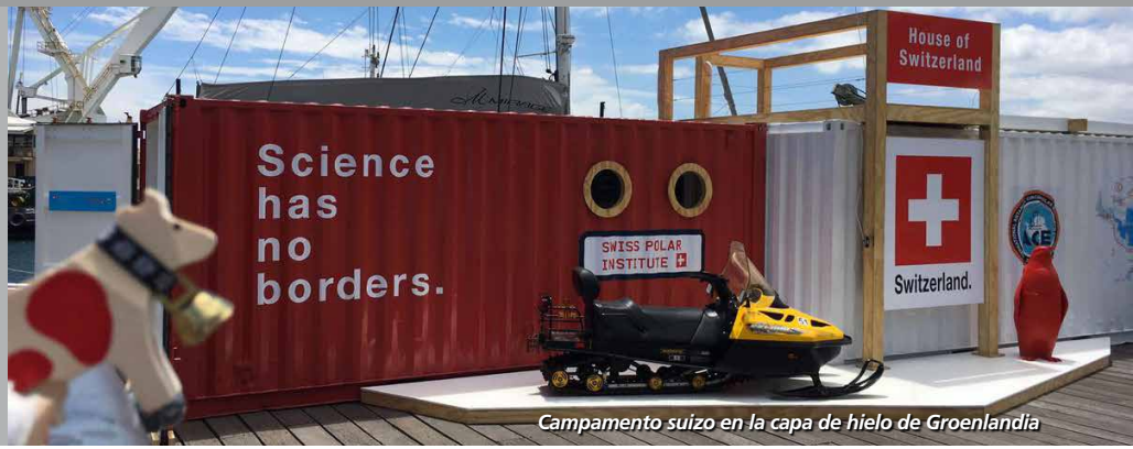
Campamento suizo en la capa de hielo de Groenlandia

El Instituto Polar Suizo (IPS) es una iniciativa que pretende estudiar los polos terrestres y otros ambientes extremos. Tiene como objetivo mejorar las contribuciones científicas, económicas y diplomáticas de Suiza para comprender y resolver los desafíos mundiales . También promueve la ciencia interdisciplinaria, los avances tecnológicos de vanguardia y las interacciones entre las instituciones públicas, la academia, la industria y los patrocinadores privados.