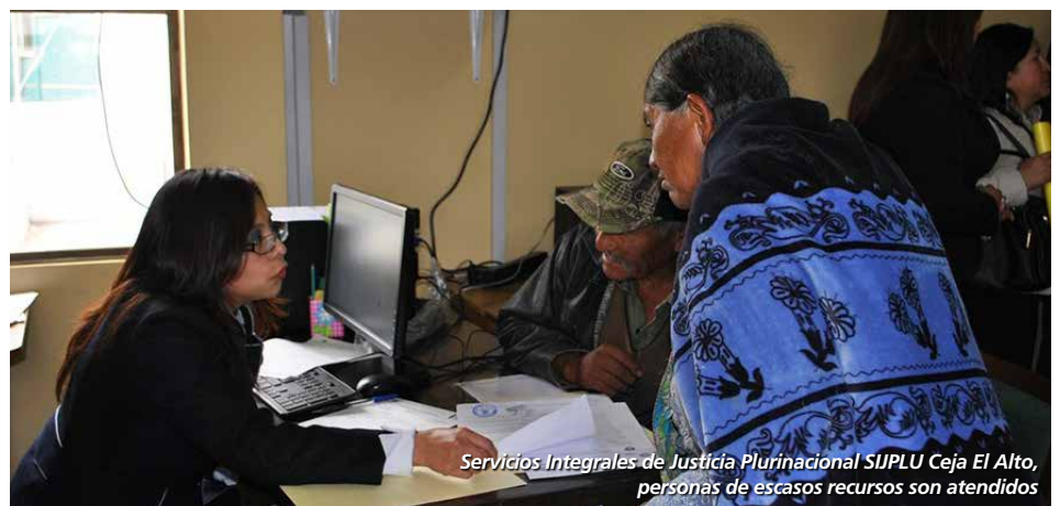
Servicios Integrales de Justicia Plurinacional SIJPLU Ceja El Alto, personas de escasos recursos son atendidos

La Conciliación no se aplica en temas de interés superior de niñas, niños y adolescentes, violencia intrafamiliar, corrupción, narcotráfico, cuando el Estado es una de las partes o se atente contra su seguridad e integridad, ni tampoco cuando se vulnere la vida, integridad física, psicológica y sexual de las personas