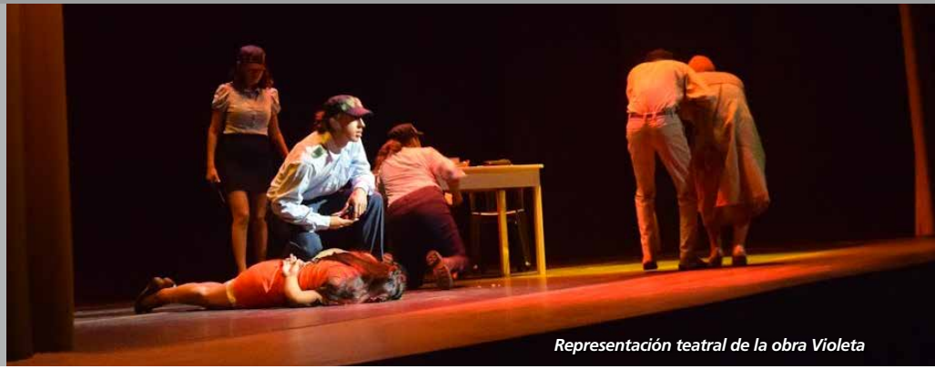
Representación teatral de la obra Violeta

En el municipio de San Lorenzo, del departamento de Tarija, el Colegio Julio Sucre decidió luchar contra la violencia de género desde el escenario teatral. A esta buena iniciativa se sumaron instituciones locales como el Servicio Legal Municipal Municipal (SLIM) y la Unidad de lucha contra la violencia del Municipio, fortaleciendo las reflexiones de las y los estudiantes.