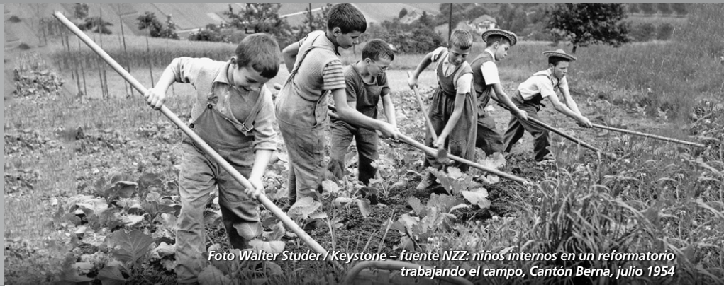
niños internos en un reformatorio trabajando el campo, Cantón Berna, julio 1954

Si usted, con residencia en Bolivia, se considera una víctima en el sentido de esta Ley y desea hacer valer su derecho a una contribución de solidaridad, se le apoyará plenamente y bajo absoluta reserva en todas las formalidades de esta solicitud