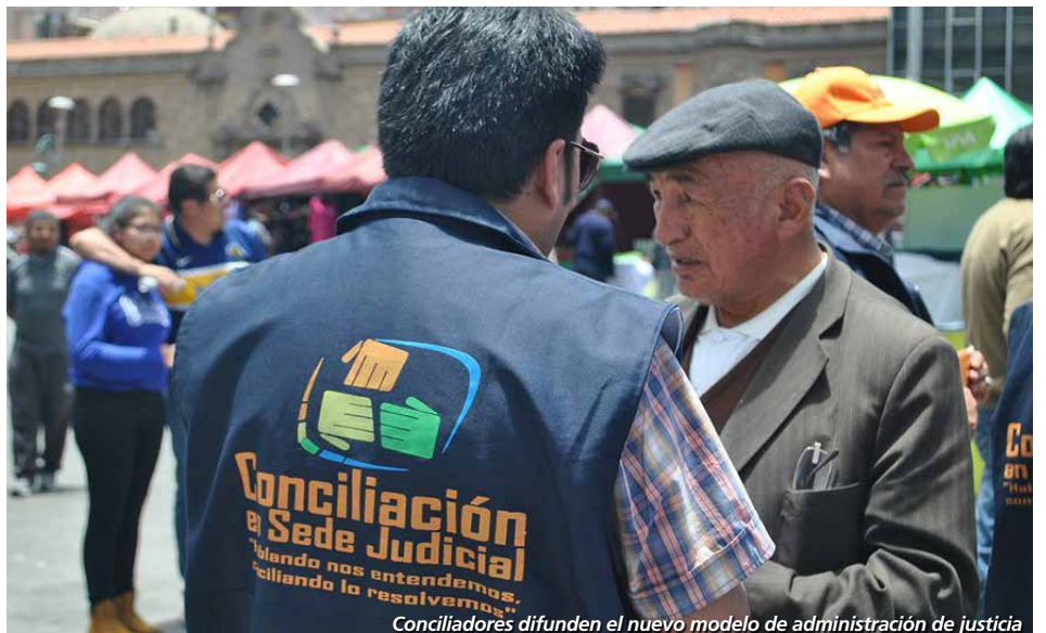
Conciliadores difunden el nuevo modelo de administración de justicia

La Conciliación se aplica, entre otros, en cobro de alquileres, devolución de anticréticos, pago de deudas/préstamos, conflicto de linderos, división de herencias, despojo de terrenos, desalojo de vivienda, incumplimiento de contratos, pago de daños y perjuicios