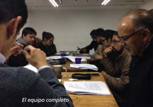
El equipo completo