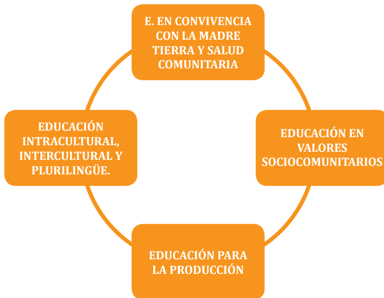
CUADRO N° 4. DE EJES ARTICULADORES DEL CURRÍCULO

La implementación de los ejes se hace posible a través de dos instancias: i) De manera vertical y secuencial en los subsistemas, niveles de complejidad y etapas de formación, que se expresa en la secuencia de los contenidos en la estructura curricular. ii) De forma horizontal manteniendo coherencia con los campos de conocimiento, áreas, disciplinas y especialidades; esos buscan fortalecer –en los seres humanos- la convivencia armónica entre la comunidad, la Madre Tierra y el Cosmos. Estos se traducen en: